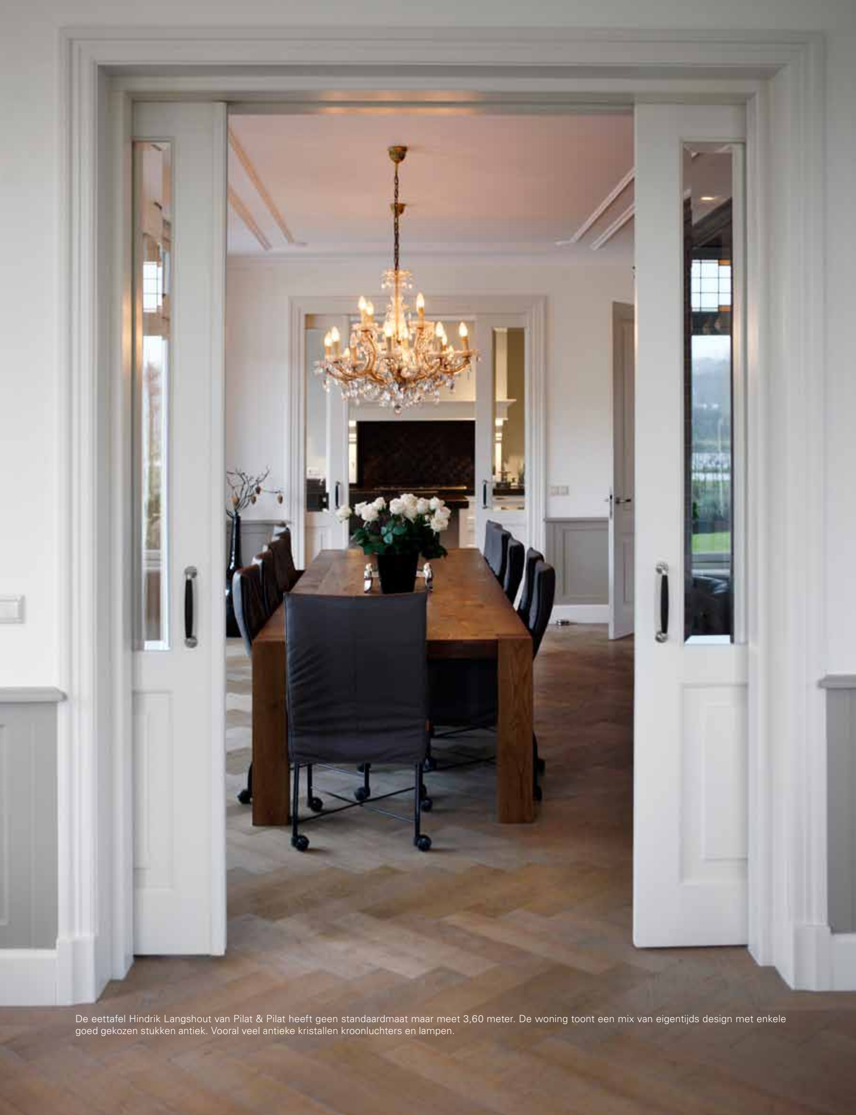
De eettafel Hindrik Langshout van Pilat & Pilat heeft geen standaardmaat maar meet 3,60 meter. De woning toont een mix van eigentijds design met enkele goed gekozen stukken antiek. Vooral veel antieke kristallen kroonluchters en lampen.